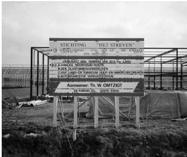
1987 Bouwbord voor Kwekerij De Amstel (Hoofdweg)

Een stichting bood meer mogelijkheden om meerdere subsidies aan te vragen bij de gemeente en overheid om de plannen voor een rondweg uit te voeren. De Gemeente van haar kant wilde al langere tijd een aantal bedrijven uit de dorpskern verplaatsten naar een industrieterrein, maar kreeg dat niet voor elkaar. De initiatiefnemers hadden deze wens van de Gemeente dus meegenomen in hun plannen en vonden de Gemeente al snel aan hun zijde.