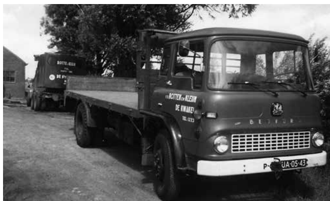
Transportbedrijf van de Rotten & Klijn)

De chrysantenteelt ontwikkelt zich zeer voortvarend. Rond 1950 is 80% van de chrysantenaanvoer op de Aalsmeerse veiling "Bloemenlust" afkomstig uit De Kwakel. In het begin worden de chrysanten per fiets met mand of bakfiets naar de veiling in Aalsmeer gebracht. Later komt er collectief vervoer op gang door de Firma Lek uit Ter Aar en de Firma Van de Rotten & Klijn uit De Kwakel. De tuinders verpakten hun bloemen in de groene bloemkisten en zetten ze voor aan de weg. Dan kwamen de vervoerders de kisten ophalen en brachten ze naar de veiling. In de namiddag brachten dezelfde vervoerders de kisten weer terug bij de tuinders. Elke tuinder had zijn eigen initialen (eerste letter van de voor – en achternaam) op de kist geschilderd, zodat de vervoerder dezelfde kisten weer kon terug brengen. De tuinders gingen naar de veiling om hun bloemen weer uit de kist te halen en ze op de veilingkarren uit te stallen op kranten.