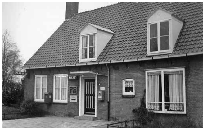
Het Oude Postkantoor