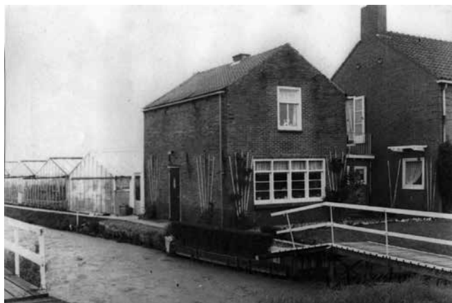
Bollenschuur Co Mathezing

De in 1929 begonnen wereldcrisis laat zich ook in De Kwakel gelden. De tijden worden slechter, jaarinkomens van fl.400,00 zijn in de jaren dertig bij de Kwakelse tuinders met hun grote gezinnen geen zeldzaamheid. Het gaat echter in het hele land erg slecht. Door een bijzondere regeling, de zogenaamde “werkverschaffing op eigen terrein” worden tuinders in staat gesteld met overheidsgeld grondverbeteringen, onder meer diepspitten en draineren, op eigen bedrijf door te voeren. Daardoor hoeven zij niet naar de werkverschaffingprojecten die overal door de overheid werden opgezet. Er worden steeds grotere schulden gemaakt en, door de financiële nood gedwongen, tuingronden verkocht en bedrijven beëindigd. Soms kan men het verkochte land tegen een lage pacht in gebruik houden.