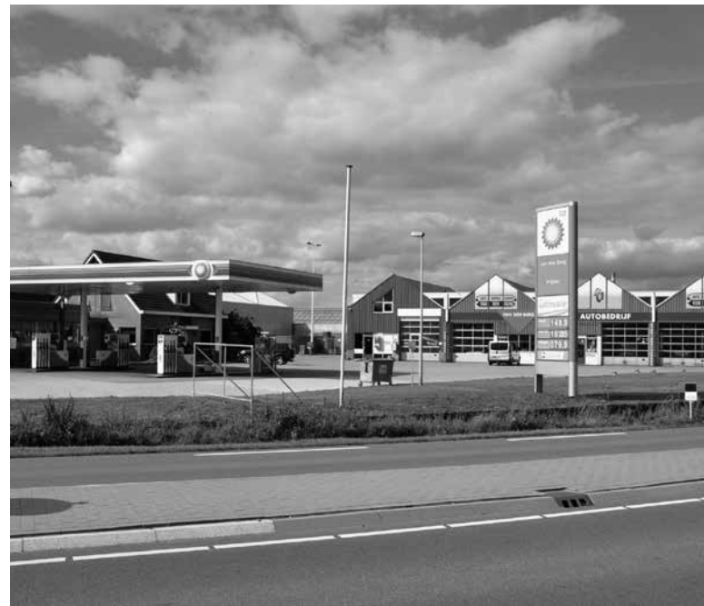
2013 Tankstation v/d Berg aan de Noord-Zuidroute

Een klein industriegebied en een rondweg om het dorp te ontlasten van het vele verkeer: twee vliegen in een klap. Een mooi stukje Kwakels ondernemerschap, niet teveel praten, plannen maken en snel uitvoeren! 1988