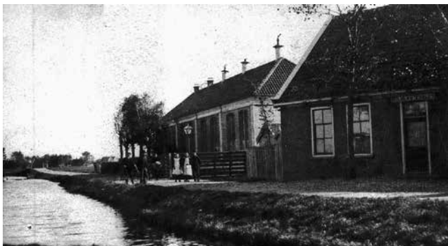
De Openbare school, Boterdijk (1905)