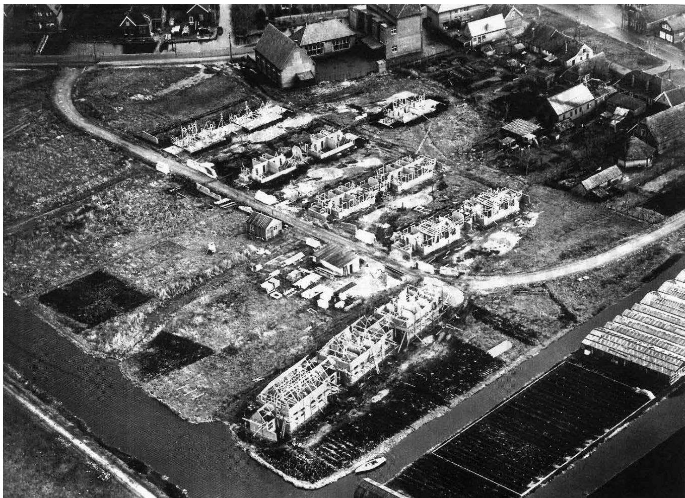
1947 De bouw van de Mgr. Noordmanlaan

Kretz uit Uithoorn bouwde de eerste fase van grotere huizen aan de kant van de school en direct achter de bebouwing achter de Kerklaan.