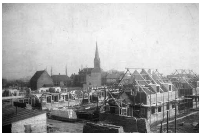
1947-1948 Bouw van de wijk (deel 1)

Kretz uit Uithoorn bouwde de eerste fase van grotere huizen aan de kant van de school en direct achter de bebouwing achter de Kerklaan.