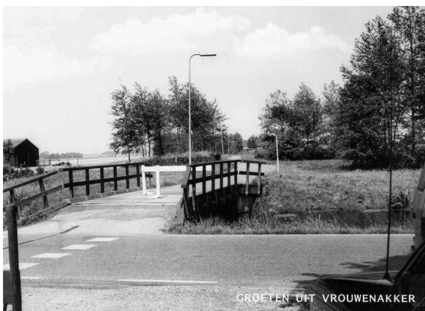
1987-Fietsbrug aan de Drechtijk en het St. Janspad

en industrieterrein aan de buitenkant van het dorp en legde dat in 1987 voor aan de gemeente Uithoorn. Deze stichting heette "Het Streven".