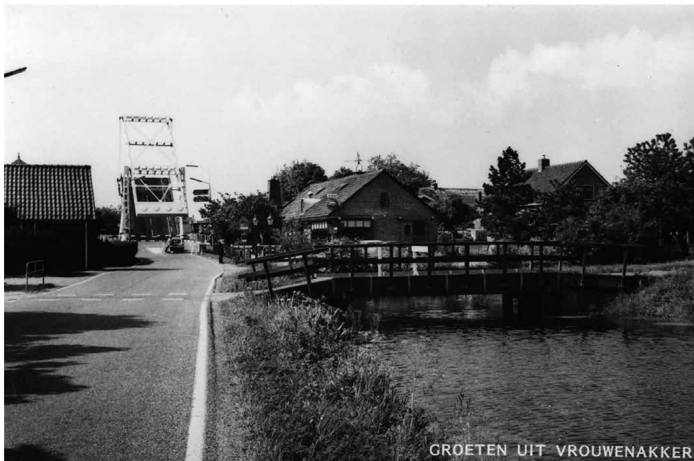
1985- Drechtijk voor de Noord- Zuidroute (rechts de fietsbrug)

Begin jaren zeventig was het autoverkeer op de route Ringdijk, Kwakelsepad en Drechtijk erg druk. In de ochtend- en avondspits lange rijen auto's waarbij de wegen helemaal volliepen. Kinderen konden niet meer veilig naar school over de Drechtijk.