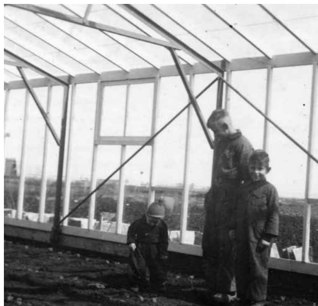
Rolkas Antoon Hoogenboom (1952)

is, verrolt men de kas naar het volgende gewas. Dit gewas wordt dan tot de oogst beschermd tegen ongunstige weersinvloeden en geeft dan een beter kwaliteits-