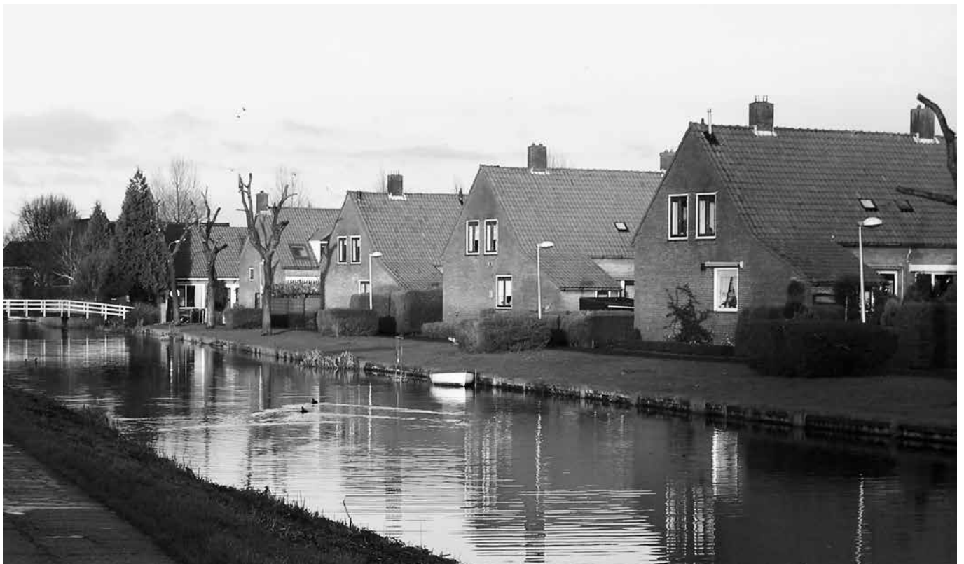
2008 Mgr. Noordmanlaan en de Ringvaart