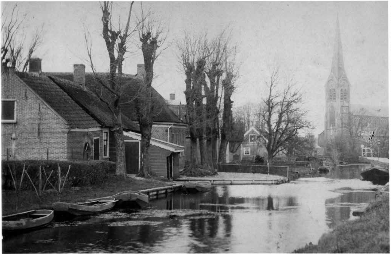
Boerderij De Verandering (Het Vaticaan) ca. 1920