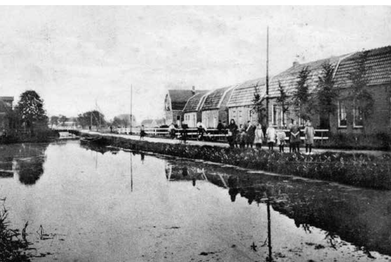
Tuinders huizen aan De Oker (Boterdijk)