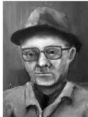
Piet Sitvast (Schilderij Hans Klootwijk)

Nu de eerste nood gelenigd was, kwam er meer aandacht voor het welzijn in het algemeen en dat van de talrijke kinderen die in de naoorlogse geboortegolf ter wereld kwamen. In de jaren vijftig was dit een kinderrijke buurt met de net opgerichte speeltuin "Jong Leven" in 1954.