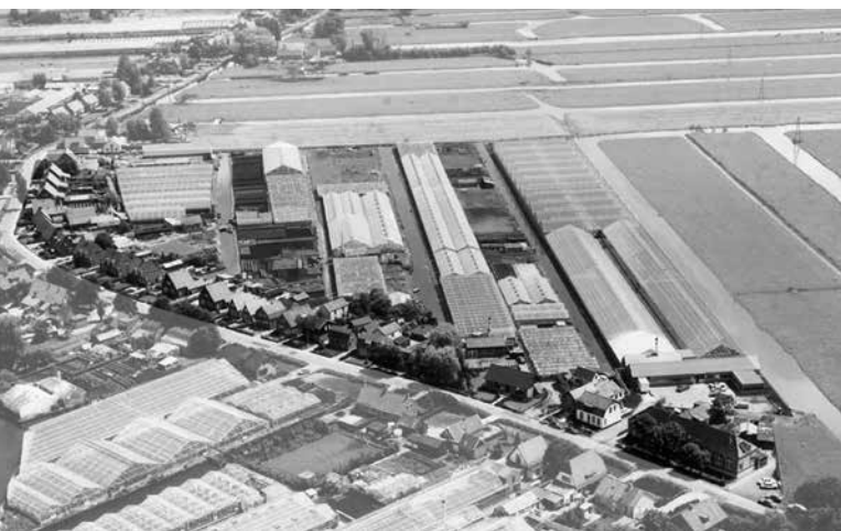
De Boterdijk en De Oker (1978)