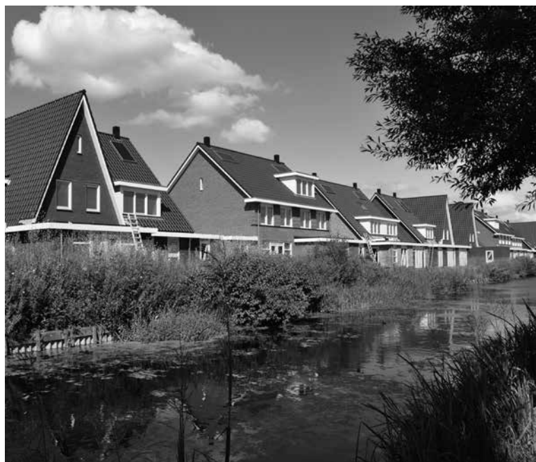
Huizen aan de grenssloot (2013)

Anno 2009 staan er niet veel kassen meer, omdat er een nieuw bouwplan van Phanos in de maak is. Er worden nog wat kassen en land verhuurd, maar het meeste ligt braak in afwachting van de start van de bouw van nieuwe woonwijk "De Oker" door bouwbedrijf HSB uit Volendam. De eerste en tweede fase is in deze zomer opgeleverd. De derde fase zijn ze nu begonnen met heien. Het heiwerk is zeker nodig in deze sponsachtige veengrond van deze landelijke polder.