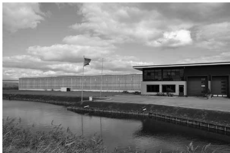
Moderne kwekerij, Van Rijn Roses (Dwarsweg - 2013)

tenland. Na de snijrozen schakelde hij langzaam over naar potrozen. Pouw Rozen was een begrip in de bloemen- en plantenwereld.