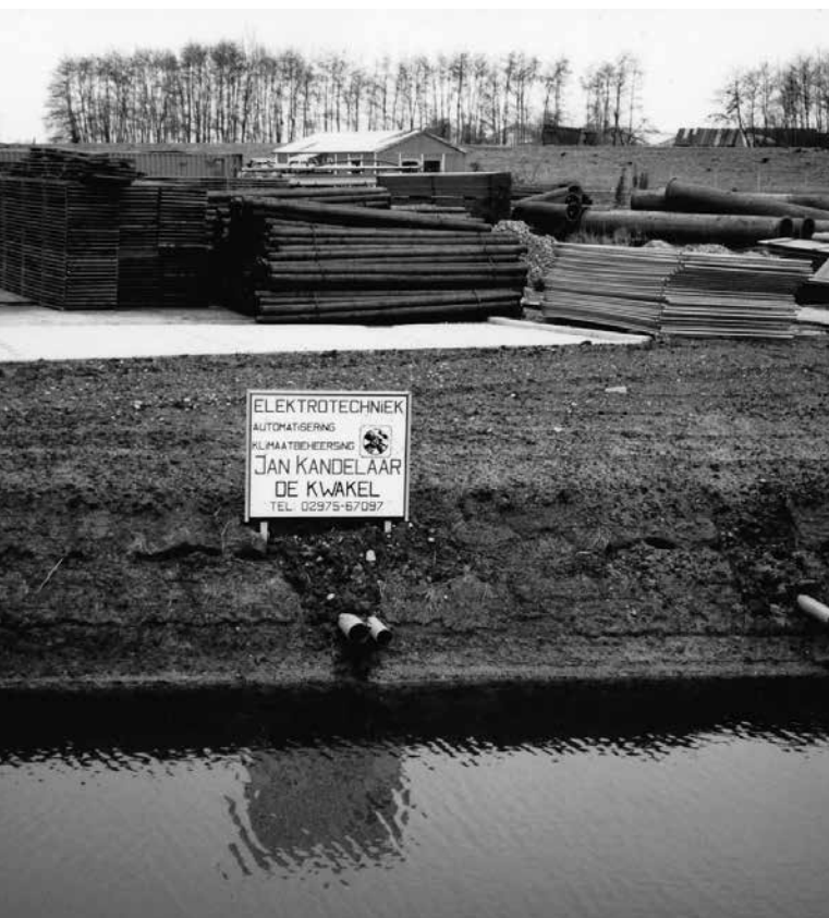
1987 Opslagdepot bij Theo Omtzigt (Bedrijvenweg)

Een stichting bood meer mogelijkheden om meerdere subsidies aan te vragen bij de gemeente en overheid om de plannen voor een rondweg uit te voeren. De Gemeente van haar kant wilde al langere tijd een aantal bedrijven uit de dorpskern verplaatsten naar een industrieterrein, maar kreeg dat niet voor elkaar. De initiatiefnemers hadden deze wens van de Gemeente dus meegenomen in hun plannen en vonden de Gemeente al snel aan hun zijde.