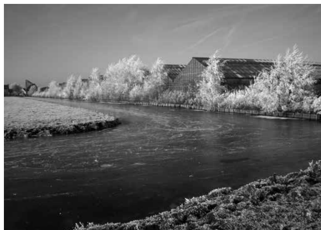
De grenssloot voor de sloop (2009)

nemende kwekers vertrokken om op andere, nieuwe grond hun bedrijf uit te bouwen. De achterblijvers bleven kleinschalig. Oudere kwekers stopten vaak met hun bedrijf, omdat het nauwelijks rendabel meer was en de opvolging naar grotere percelen uitgeweken was.