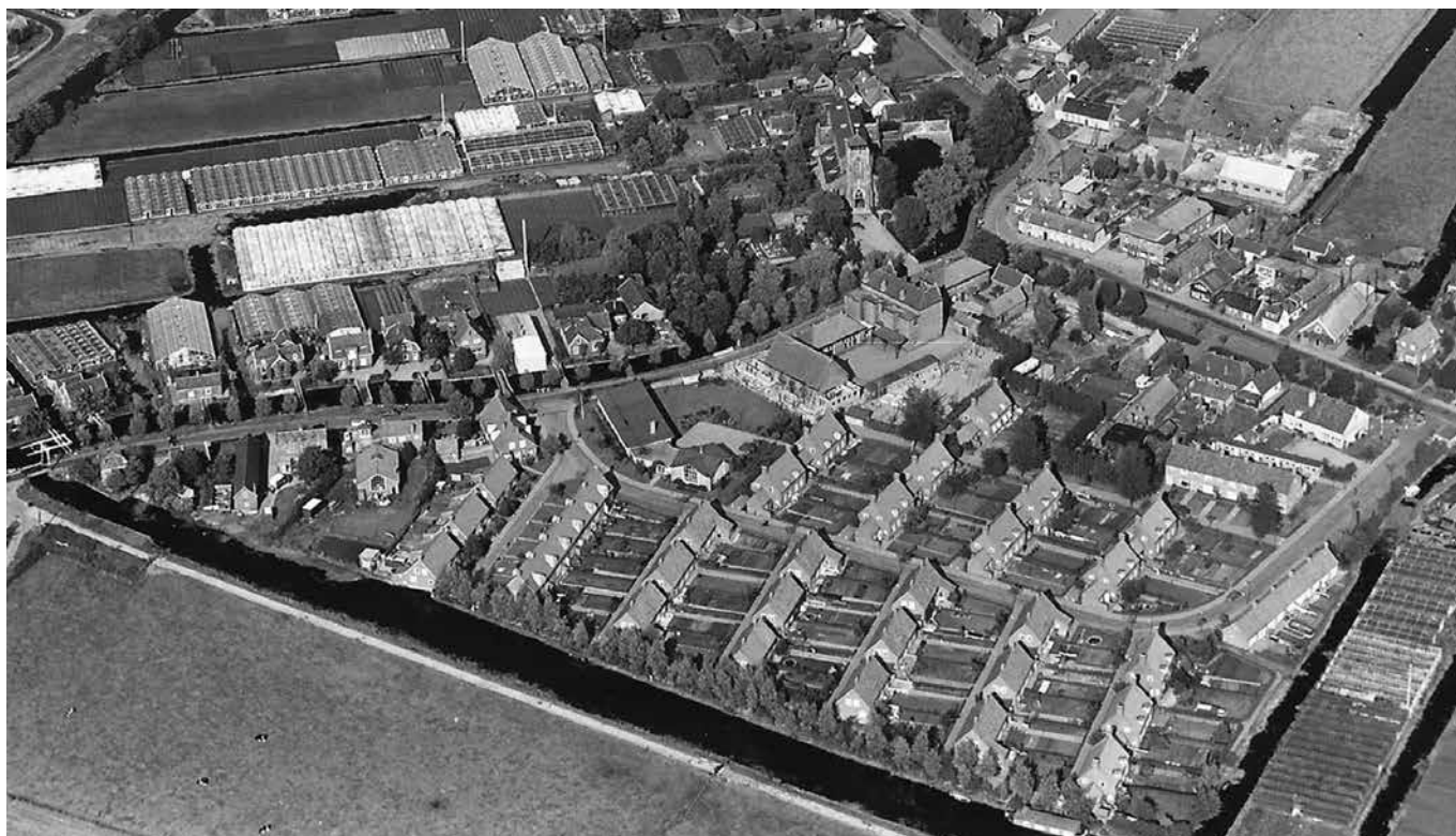
1961 Luchtfoto Mgr. Noordmanlaan