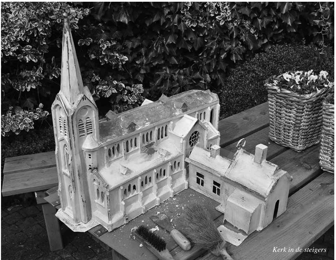
Kerk in de steigers

Na grondig schuren en in de primer gezet, was het al een heel ander gezicht. Hierna heb ik de verf in rode steenkleur laten mengen en hem geschilderd. Daarna