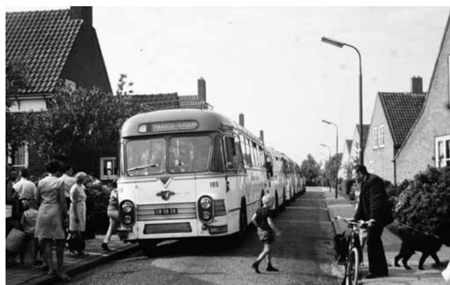
1964 De Jeugd van de Straat

De speeltuin nam een belangrijke plaats in in de jeugdige nieuwbouwwijk. De speeltuinvereniging organiseerde ook elk jaar een uitje onder de naam “De jeugd van de straat”. Dit was een dagreisje ergens buiten De Kwakel, naar de Pyramide van Austerlitz, het Groendaalse- of Amsterdamse Bos en soms naar de Efteling in Kaatsheuvel bijvoorbeeld. De kinderen gingen dan met brood en drinken in de tas een dagje uit met bussen van Maarse & Kroon, die opgesteld stonden in de Mgr. Noordmanlaan.