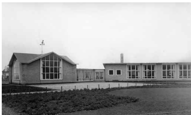
1952 Kleuterschool St. Jozef

In datzelfde jaar is ook de kleuterschool "St. Jozef" geopend met 2 lokalen en een aula. In 1953/54 volgde het blok huizen (nr.16 t/m 26) tegenover de nummers 4 t/m 14, dit blok is gebouwd door de Firma Gortemulder en werd in juni 1954 opgeleverd.