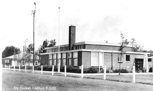
Sporthal en kantine (1962)

De jeugdcommissie organiseerde op de zaterdagmiddagen complete competities zaalvoetbal voor de jeugd, dat was er nog nergens in de buurt. KDO had nu een mooie kleine sporthal, wat weer aanleiding gaf tot de oprichting in maart 1965 van een Volleybal afdeling. En naast de voetbal- en handbalclub werd het nu een sportvereniging met 3 afdelingen.