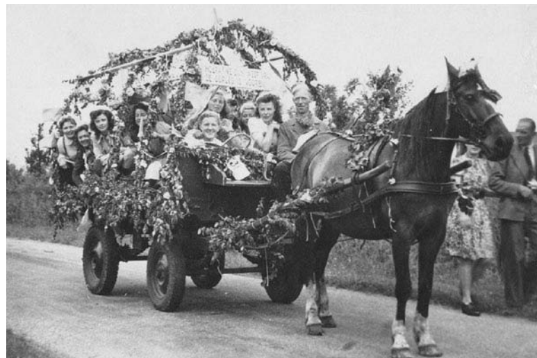
Bevrijdingsoptocht, juni 1945

De periode 1940-1945 was voor muziekvereniging Tavenu, als voor zovelen, een donkere tijd, maar bij de bevrijding in 1945 bleek Tavenu springlevend. Er was weer volop werk aan de winkel, de bevrijding werd daarom ook uitbundig gevierd en wat zou De Kwakel geweest zijn zonder haar muziekvereniging?