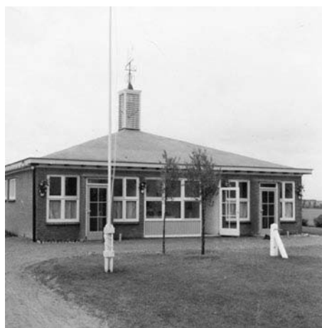
KDO clubhuis aan het Hanenpad (1957)