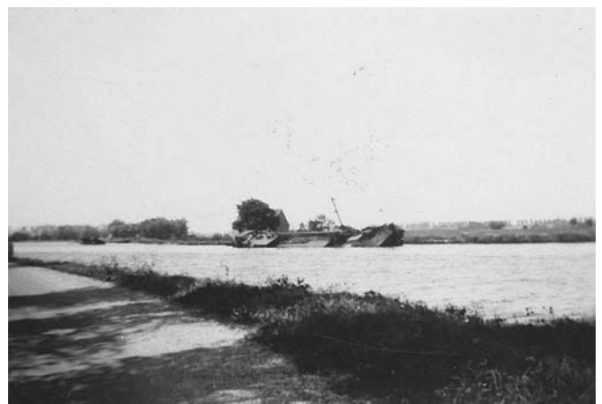
Gezonken munitieschip aan het Jaagpad

In het voorjaar van 1940 vielen de troepen van Adolf Hitler Denemarken en Noorwegen binnen. De oorlog naderde steeds duidelijker Nederland en daarom werd er een tiental kruitschepen vanuit Muiden, waar een grote kruitfabriek stond, overgebracht naar een aantal rustige ligplaatsen tussen Vrouwenakker en Tolhuis. Marinemensen bemanden deze schepen en liepen wacht op de kade. Op 10 mei overviel de vijand het land: bommenwerpers vlogen naar Rotterdam en Schiphol: aan twee horizons kon men hoog opstijgende rookwolken zien. De Duitsers lieten de schepen met rust. Na vier dagen van strijd gaf Nederland zich over. Het gevaar voor bombardementen op de kruitschepen was voorbij, tot opluchting van de bewoners langs het Amstel-Drechkanaal en in Vrouwenakker. Sommige mensen daar waren gevlucht voor het gevaar. De nederlaag kwam zo snel, dat men dacht aan verraad van binnenuit; terugkerende militairen brachten hun verhalen daarover naar huis. Het kan zijn dat dit een rol gespeeld heeft toen de bemanningen van de kruitschepen overgingen tot het laten zinken van hun schepen door de kranen open te draaien. De vijand zou daardoor niets meer kunnen doen met hun explosieve inhoud. In het najaar van 1940 zijn de schepen door de Duitsers gelicht en afgevoerd