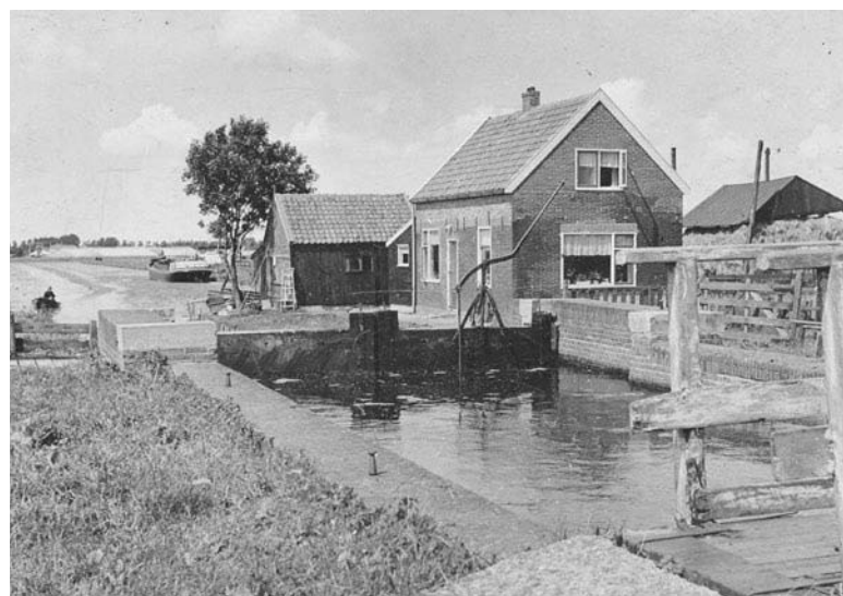
Jan Ploegensluis en het woonhuis