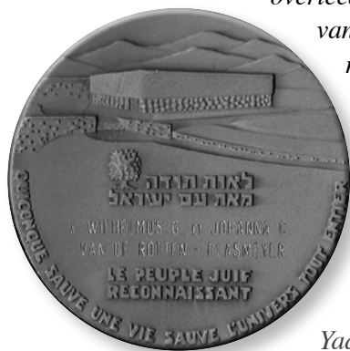
Yad Vashem, onderscheidingsmedaille